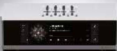
NT-1 Digital Audio Transport 4799 €