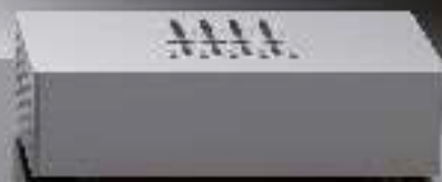
SC-1 Horloge Audio de Référence 6499 €