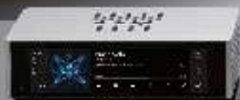
TT-1 Digital Audio Transport 2199 €